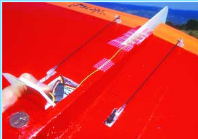
Bild links: Die Bausätze sind vollständig und exakt verarbeitet. Bild rechts: Einfacher geht es nicht: direkte Anlenkung der Ruder über CFK-Stäbe. Das Fünfc-Cent-Stück am Rumpf diente zur Schwerpunktkorrektur – eine zusätzliche „Aufwertung“ des Modells.

Ich habe es mit beidem versucht, und muss sagen, dass mit Bügelfolie und selbstverständlich reichlich Sprühkleber „77“ der Firma 3M, das bessere Resultat zu erzielen war, sprich eine bessere Haftfestigkeit, bei einer gleichmäßigeren Oberfläche. Dies muss allerdings mit einem etwas höheren Gesamtgewicht erkauft werden, beim „Weasel“ ca. 20 g. Eine zu vernachlässigende Größe, wie ich meine, bei einem Fluggewicht von letztlich 310 g und einer daraus resultierenden Fläche-