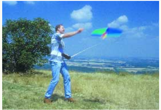
Bild links: Der „Mini-Weasel“ ist durch seine geringen Abmessungen ein echtes „Koffermodell“. Bild rechts: Selbst schwingvolle SAL-Starts gelingen mit „Mini-Weasel“ ganz gut.

deres Vergnügen für Pilot und Zuschauer. Wobei der „Mini-Weasel“ dem Piloten ein wenig mehr Konzentration und Können abverlangt, da er etwas kippeliger, spricht direkter, auf die Steuerbefehle reagiert als der große Bruder. Kurzum: Die „Weasel“-Modelle machen, was der Pilot ihnen „aufträgt“ und dies schnell und präzise. Gutmütig und anfängertauglich reagieren die Winzlinge bei kleinen Ruderausschlägen, enorm wendig und spritzig bei größeren. Richtige Allround-Spaßmodelle also, bei denen es ganz auf den Piloten ankommt, was er daraus macht.