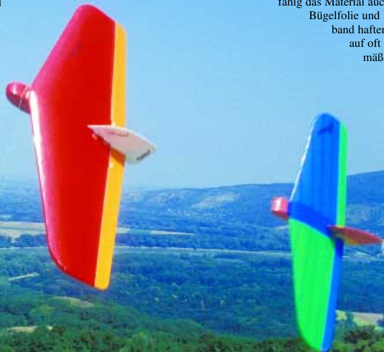
„Weasel“ und „Mini-Weasel“ im Formationsflug über Österreich.

bespannt. In der Bauanleitung werden Flügel und Rumpf zuerst vollständig mit farbigem Paketband bespannt. Darauf wird dann ein doppelseitiges Klebeband angebracht und beide Teile miteinander verklebt. Meines Erachtens besteht dabei jedoch die Gefahr, dass sich bei härteren Landungen oder bei kälteren Temperaturen das Klebeband vom EPP löst. Womit wir auch gleich bei einem allgemeinen Problem bei EPP-Modellen wären: die Bespannung. So widerstandsfähig das Material auch ist, Bügelfolie und Klebeband haften darauf oft nur mäßig.