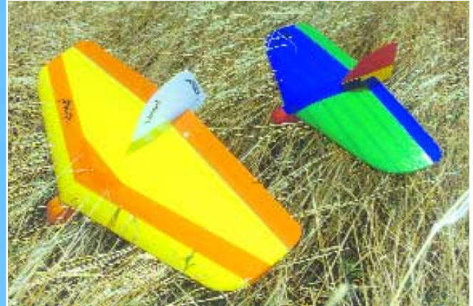
„Weasel“ und „Mini-Weasel“ im direkten Größenvergleich, hier noch beide mit Tape bespannt.

„Weasel“ und „Mini-Weasel“ unterscheiden sich im Zusammenbau nur unwesentlich. Die Qualität des Bausatzes ist als hoch einzustufen, es passt und sitzt alles maßgenau. Die Aussparungen für Holm und Flächenverbinder sind exakt geschnitten und sogar die 45°-Schrägung bei den Rudern ist schon vorgefertigt. Einzig die Nasenleiste ist noch rund zu schleifen, was jedoch mit einem längeren, harten Schleifklotz und einem nicht allzu groben Schleifpapier recht zügig über die Bühne geht. Die Ruder werden mit Kohlefaserstäben direkt angelenkt, was spielfreie und dennoch stoßabsorbierende Anlenkungen ergibt. Als einzige Abweichung vom Bauplan habe ich Rumpf und Tragfläche zuerst mit 5-Min.-Epoxy zusammengeklebt und anschließend das Modell